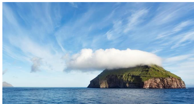
Figura 2 – Ilha Lítla Dímun, Ilhas Faroé (Dinamarca)

A figura 2 apresenta a ilha Lítla Dímun, localizada no arquipélago das Ilhas Faroé (Dinamarca). É possível observar nesta imagem um efeito conhecido localmente de permanência constante de uma nuvem no seu topo.